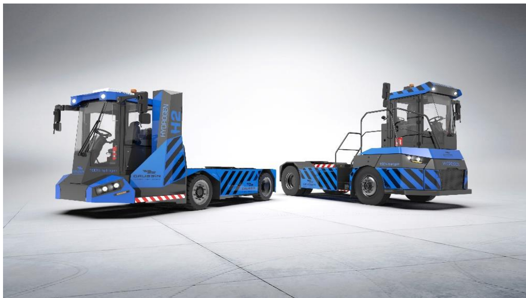
L'ATM-H2 et l'APM-H2, nouveaux fers de lance de la gamme de véhicules GAUSSIN

Enfin, cette technologie ouvre la voie à d'autres innovations pour l'avenir. L'hydrogène est non seulement un acteur majeur pour l'avenir du transport de charges lourdes mais aussi un vecteur énergétique important dans l'avènement des énergies solaires et éoliennes. Avec l'hydrogène, il devrait être possible de lisser la production de ces énergies propres et de mieux les intégrer aux réseaux de distribution électrique.